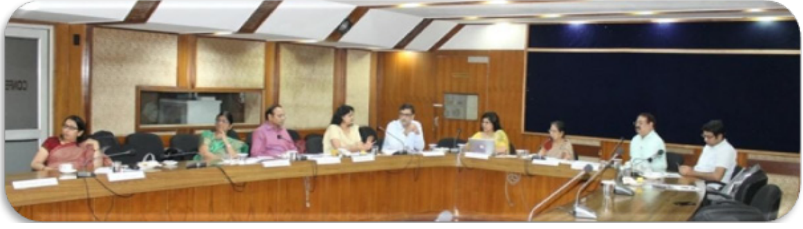
राष्ट्रीय प्रतिरक्षण तकनीकी सलाहकार ग्रुप की बैठक

परिवार कल्याण मंत्रालय तथा सह-अध्यक्षता सचिव, जैव प्रौद्योगिकी विभाग और सचिव, स्वास्थ्य अनुसंधान विभाग द्वारा की गई। एनटीएजीआई में एक स्थायी तकनीकी उप-समिति (एसटीएससी) भी शामिल है। जिसमें एनटीएजीआई एक स्वतंत्र सदस्य है। एनटीएजीआई ग्रुप को टीकाकरण नीति और कार्यक्रमों से संबंधित मामलों पर वैज्ञानिक साक्ष्य की तकनीकी समीक्षा करने का कार्य सौंपा गया है। एनटीएजीआई ने अंतिम संस्तुतियों का प्रारूप एसटीएससी और अन्य प्रासंगिक साक्ष्य से प्राप्त वैज्ञानिक समीक्षा को ध्यान में रखकर तैयार किया।