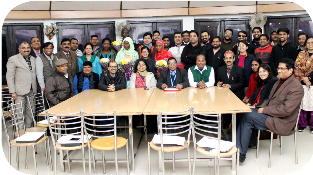
पीपीडीपीएचएम तथा एम.डी.(सीएचए) छात्र

संस्थान द्वारा स्वास्थ्य और परिवार कल्याण मंत्रालय, भारत सरकार तथा जन स्वास्थ्य फाउंडेशन के सहयोग से जन स्वास्थ्य प्रबंधन में पोस्ट-ग्रेजुएट डिप्लोमा संचालित किया जाती है। जीओआई भागीदारों द्वारा जनसंख्या और विकास (पीपीडी) में सुविधा प्राप्त दस अंतर्राष्ट्रीय छात्रों के लिए अध्येतावृत्ति दी जाती है। वर्ष 2019-20 के सत्र में, भारत के उन्नीस राष्ट्रीय छात्रों ने प्रवेश लिया। पीपीडी द्वारा नामित एक अंतर्राष्ट्रीय छात्र (जाम्बिया से) पाठ्यक्रम में शामिल हुआ। इस पाठ्यक्रम की शुरुआत के बाद से, 191 छात्रों ने इसे उत्तीर्ण किया है।