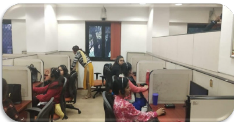
MCTFC Employees Interacting with the Community in the Facility

MCTFC is currently operational with 86 Helpdesk Agents. The agents are responsible for making outbound calls and answering calls of beneficiaries and health workers every day except on national holidays. In addition, there are 2 doctors who respond to the specific queries of beneficiaries and health workers and provide non-clinical advice to them.