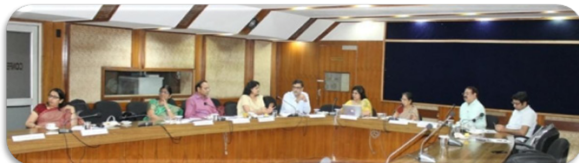
Meeting of the National Technical Advisory Group on Immunization

NTAGI Secretariat: The NTAGI Secretariat was established in 2013, to provide techno-managerial support to NTAGI and STSC and its working groups. In NIHF, Secretariat resumed its functioning since May, 2017. The NTAGI Secretariat is responsible for organizing NTAGI and four STSC meetings in a year.