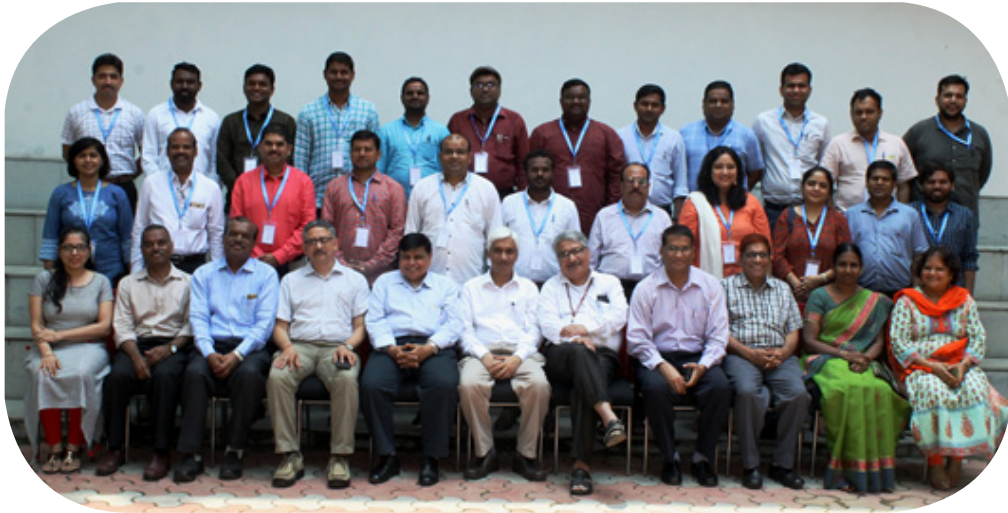
व्यासायिक एवं पर्यावरण स्वास्थ्य पर प्रशिक्षण पाठ्यक्रम