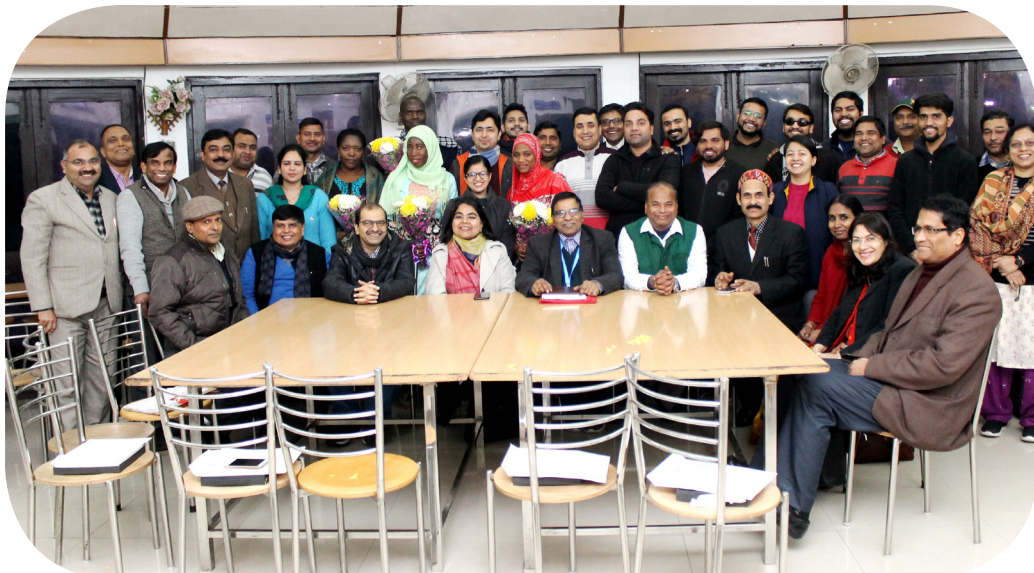
PGDPHM and MD (CHA) students

NIHFW in collaboration with the Ministry of Health and Family Welfare, Government of India (GoI) and Public Health Foundation of India offer a Post-Graduate Diploma in Public Health Management. The GoI gives fellowships for ten international students facilitated by Partners in Population and Development (PPD). Nineteen national students from India enrolled for the year 2019-20. One international student nominated by PPD (from Gambia) joined the course. Since the introduction of this course, 191 students have passed out hitherto.