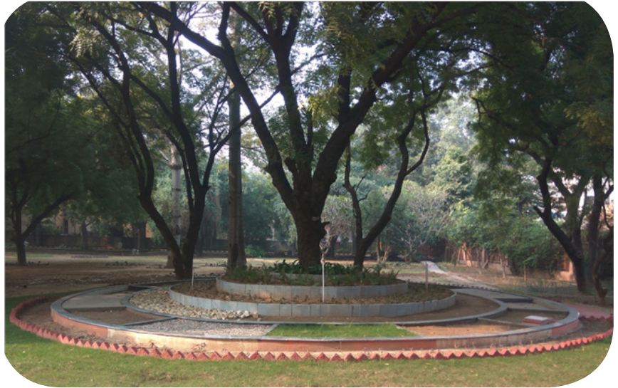
संस्थान का फिटनेस पथ

हर किसी के दैनिक जीवन को ध्यान में रखते हुए, संस्थान ने “फिट इंडिया मूवमेंट” विषय पर एक फिटनेस पथ बनाया है, जो माननीय प्रधानमंत्री श्री नरेंद्र मोदी द्वारा सितंबर, 2019 में प्रस्तावित है। संस्थान के कर्मचारियों के बीच फिटनेस को बढ़ावा देने के उद्देश्य से, पूरी तरह से हरियाली और ताजा वातावरण के साथ इंटरनेशनल हॉस्टल के पीछे के रास्ते को फिटनेस पथ बनाया गया।