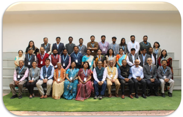
भारत में सार्वजनिक स्वास्थ्य कवरेज को गति प्रदान करने के लिए स्वास्थ्य कार्यबल का इष्टतमीकरण:स्वास्थ्य हेतु मानव संसाधनों पर आगामी सम्मेलन के लिए सम्मेलन पूर्व बौद्धिक मंथन कार्यशाला