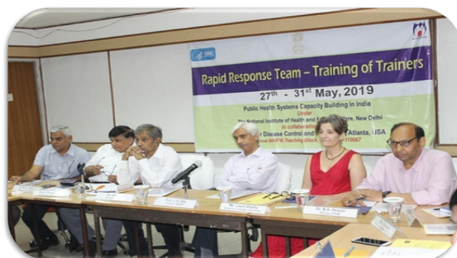
Rapid Response Team Training

The NIHFV, in collaboration with the US Centers for Disease Control and Prevention (CDC), has a project Public Health Systems Capacity Building in India (PHSCBI) since 2014. The PHSCBI project functions under the Global Health Security Agenda where the US CDC is supporting the Government of India (GoI) in providing technical and financial support in capacity building of the public health workforce in India. The three different training courses, under the umbrella of PHSCBI project are: