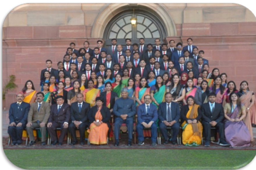
4th Foundation Training Programme Batch of Central Health Services Officers with Hon'ble President of India

The Honorable President in his address to the participants asked the doctors to serve the country with a deep sense of commitment and wished them all success in their career ahead.