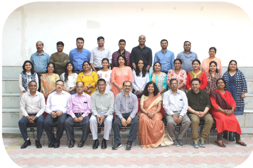
Faculty and Students of the Diploma in Health and Family Welfare Management Course

This course is recognized from AICTE with 300 annual intake admissions for the batch 2019-20 with 15 months' duration. The Post-Graduate Diploma in Management (Executive) with specialization in Hospital Management has been specially designed to impart knowledge to the participants about the existing structure and functioning of the health care system including managerial problems in hospitals. In addition, various management concepts, techniques, tools and resource management are discussed in this course which is open to medical, nursing, dental and AYUSH graduates. 111 candidates were enrolled for 2019-20.