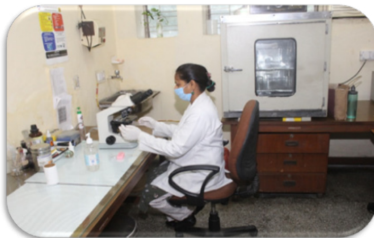
रास्वापक. संस्थान क्लिनिक की प्रयोगशाला