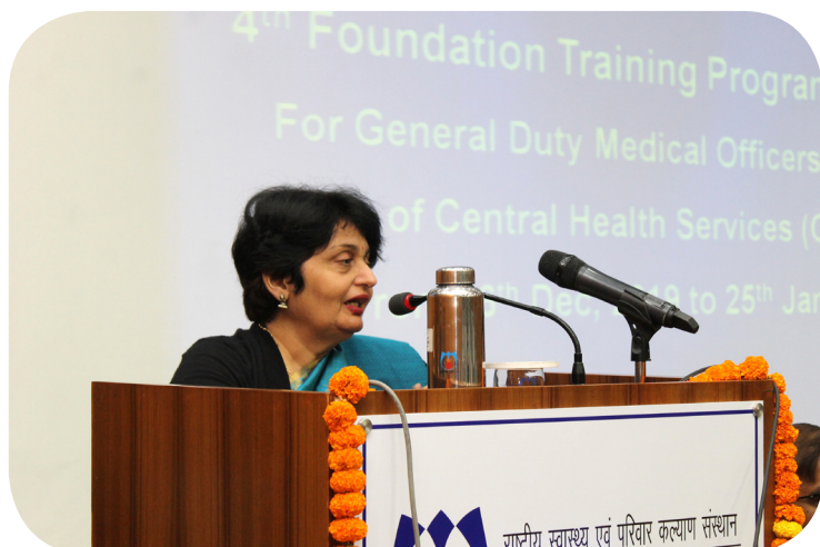
Ms. Preeti Sudan, Secretary, MoHFW, GOI Inaugurating 4th Foundation Training Programme for General Duty Medical Officers under Central Health Services

acumen of the newly recruited General Duty Medical Officers (GDMOs) with focused exposure to health care delivery systems and holistic approach to wellness including AYUSH system. The training was attended by 85 participants. Out of which 47 (55.3%) were males and 38 (44.7%) were females.