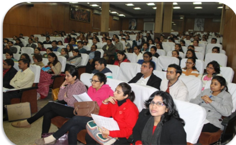
Diploma in Hospital Management students in academic session

During 2019-20, 71 candidates appeared in the examination out of which 62 have successfully completed the course.