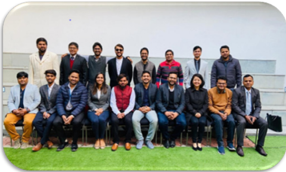
MD (CHA) and DHA students