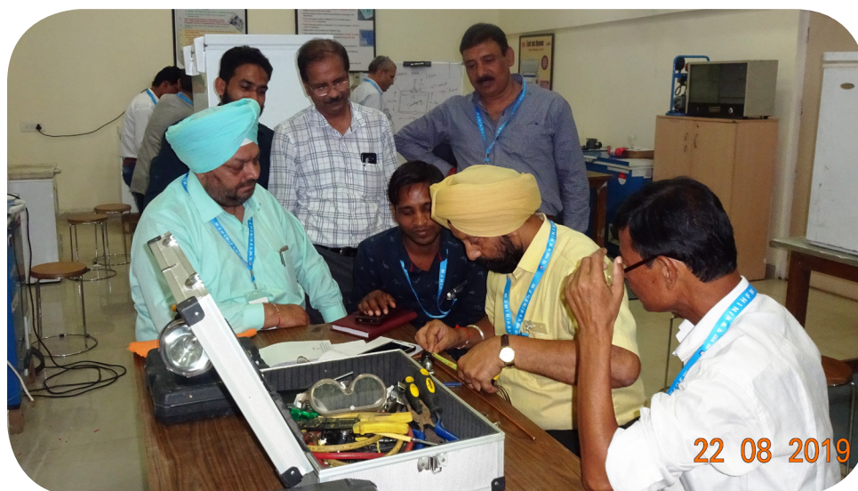
कोल्ड चैन तकनीशियनों हेतु प्रशिक्षण पाठ्यक्रम