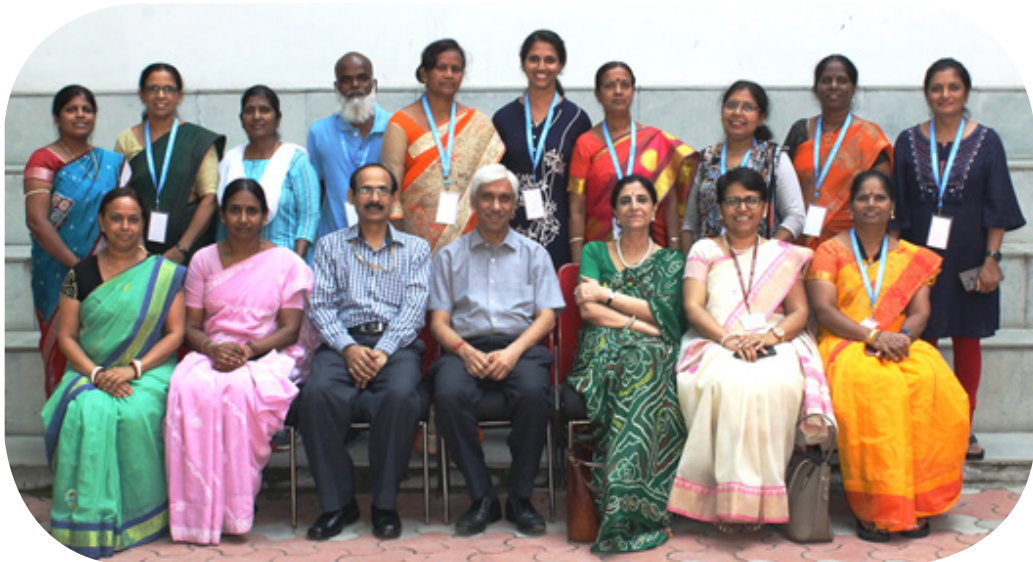
वरिष्ठ नर्सिंग प्रशासकों के प्रबंधन पर प्रशिक्षण पाठ्यक्रम