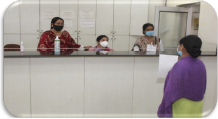
संस्थान के क्लिनिक में स्वागत पटल पर रोगी पंजीकरण

राष्ट्रीय स्वास्थ्य एवं परिवार कल्याण संस्थान प्रजनन स्वास्थ्य देखभाल में उत्कृष्ट केंद्रों में से एक माना जाता है। राष्ट्रीय स्वास्थ्य एवं परिवार कल्याण संस्थान में आरबीएम विभाग के क्लिनिक से नैदानिक सेवाएं प्रदान की जाती हैं। बांझपन प्रबंधन, प्रजनन संबंधी एंडोक्रिनोलॉजिकल और स्त्री रोग संबंधी विकारों के प्रबंधन, प्रसवपूर्व देखभाल, जन्मजात रोगियों, बच्चों के लिए सेवाएं प्रदान की जाती हैं। दोपहर में, किशोर और युवा एवं महिला क्लीनिक भी चलाए जाते हैं। सभी रोगियों के लिए पंजीकरण निःशुल्क है। प्रयोगशाला सेवाओं सहित गरीब रोगियों को सेवाएं बिना किसी भी शुल्क के मुफ्त प्रदान की जाती हैं। बाकी रोगियों के लिए, संस्थान के मानदंडों के अनुसार शुल्क लागू होते हैं। क्लिनिक में गरीब मरीजों को मुफ्त दवा देने के लिए एक इन-हाउस फार्मसी भी है। निस्तान मरीजों को पहली बार आने पर प्रबंधन के लिए एक जोड़े के रूप में पंजीकृत किया जाता है। बाद के सभी अनुवर्ती परामर्श उसी डॉक्टर के साथ निर्धारित किए जाते हैं, जो देखभाल की निरंतरता सुनिश्चित करता है और डॉक्टर-रोगी संबंध बनाता है। अधिकांश प्रयोगशाला इन-हाउस रूप में उपलब्ध हैं और प्रयोगशाला सेवाएं स्वास्थ्य देखभाल सेवाओं के निवारक और उपचारात्मक पहलुओं की रीढ़ हैं। हर रोगी के लिए रिकॉर्ड रूम में बहिररोगी चिकित्सा रिकॉर्ड बनाए जाते हैं और जब भी मरीज आगे परामर्श के लिए जाते हैं तो उन्हें पुनः प्राप्त कर लिया जाता है। सभी इन-हाउस प्रयोगशाला रिपोर्ट मरीजों के संबंधित केस रिकॉर्ड फाइलों में दर्ज की जाती हैं ताकि मरीज द्वारा रिपोर्ट-संग्रह की परेशानी को कम किया जा सके। प्रदान की जा रही सेवाओं का विवरण इस प्रकार है: