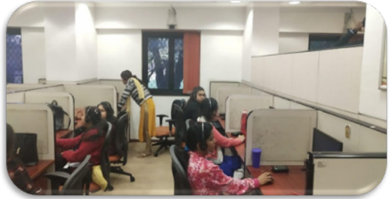
मातृ एवं शिशु ट्रेकिंग सुविधा केन्द्र के कर्मचारी लाभानुभोगियों तथा स्वास्थ्य कार्यकर्ताओं के साथ बातचीत करते हुए

वर्तमान में मातृ एवं शिशु ट्रेकिंग सुविधा केन्द्र का संचालन 86 हेल्पडेस्क एजेंटों द्वारा किया जाता है। एजेंट द्वारा राष्ट्रीय अवकाश के दिनों के अतिरिक्त प्रत्येक दिन आउटबाउंड कॉल की जाती हैं तथा लाभानुभोगियों तथा स्वास्थ्य कार्यकर्ताओं को कॉल के माध्यम से प्रश्नों का उत्तर देते हैं। इसके अतिरिक्त 2 चिकित्सकों को भी नियुक्त किया गया है जो लाभार्थियों और स्वास्थ्य कर्मियों के विशिष्ट प्रश्नों का उत्तर देते हैं और उन्हें गैर-नैदानिक सलाह भी प्रदान करते हैं।