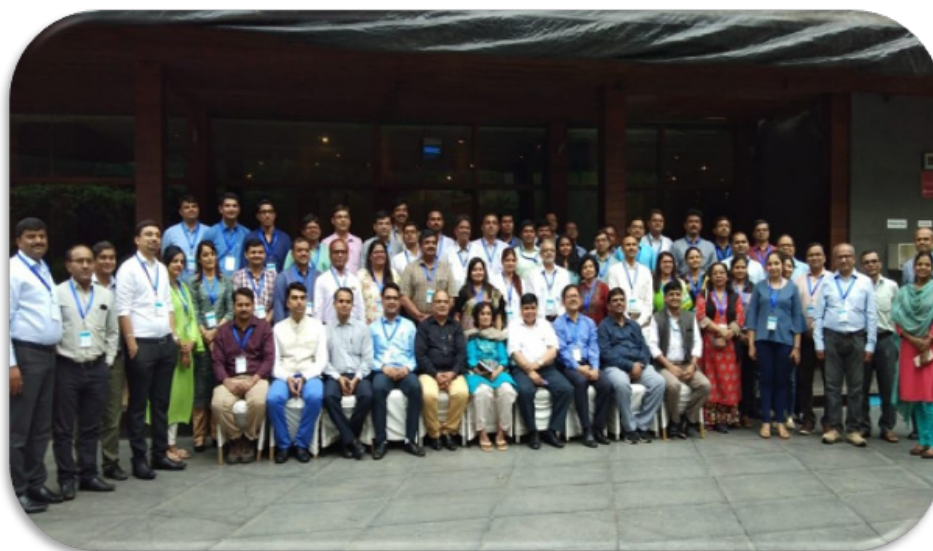
सी.डी.सी अटलांटा द्वारा आयोजित प्रशिक्षण पाठ्यक्रम

प्रासंगिक कार्य पत्रक की केस अध्ययन सामग्री क्षेत्रों के साथ मिलान में महत्वपूर्ण भूमिका थी। प्रशिक्षण के लिए कौशल विकास की आवश्यकता होती है। डमी, मॉडल और अन्य प्रशिक्षण सहायता सामग्री का उपयोग करते हुए अभ्यास के लिए 'हैंड्स ऑन ट्रेनिंग' दी गई। शिक्षण के अनुभवों का समर्थन करने के लिए क्षेत्र की दौरे (विजिट) किए गए। अधिकांश प्रशिक्षणों में, प्रशिक्षण की आवश्यकताओं एवं उद्देश्यों के अनुसार 'कार्य योजना' विकसित करने के लिए समयबद्ध योजना तैयार की गई थी। प्रतिभागियों ने संकाय से इनपुट के साथ 'कार्य योजना' विकसित की, जिन पर गहन चर्चा की गई तथा संशोधनों को शामिल किया गया।