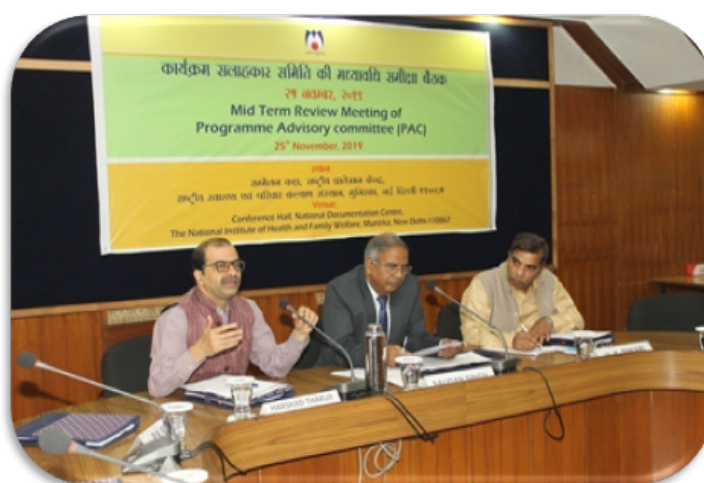
मध्यावधिसमीक्षा कार्यक्रम सलाहकार बैठक

संस्थान में भारत सरकार द्वारा प्रारंभ की गई विभिन्न गतिविधियों और राष्ट्रीय स्वास्थ्य कार्यक्रमों का मूल्यांकन एवं अध्ययन संचालित किया जाता है।