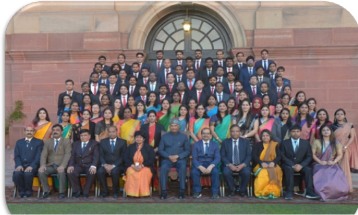
भारत के माननीय राष्ट्रपति के साथ चौथे फाउंडेशन प्रशिक्षण कार्यक्रम बैच के केंद्रीय स्वास्थ्य सेवा अधिकारी