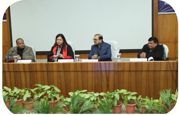
श्रीमती मीनाक्षी लेखी, संसद सदस्य और भारत के सर्वोच्च न्यायालय के वकील, सीएचएस के तहत 4वें एफटीपी जीडीएमओ के प्रतिभागियों को संबोधित करते हुए।

माननीय राष्ट्रपति ने प्रतिभागियों से अपने संबोधन में चिकित्सकों को प्रतिबद्धता की मूल भावना के साथ देश की सेवा करने के लिए कहा और उनकी सफलता की कामना की।