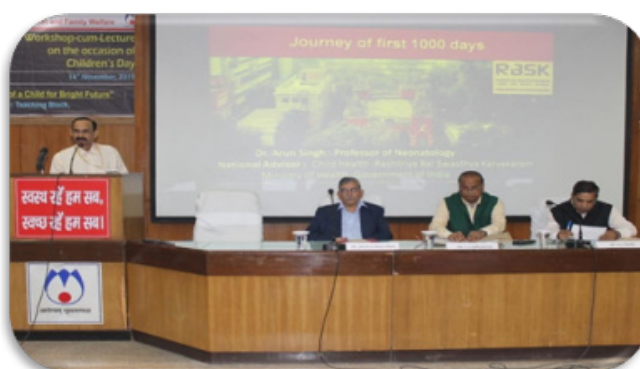
Inaugural Session of the Workshop cum Lecture on the Occasion of Children's Day