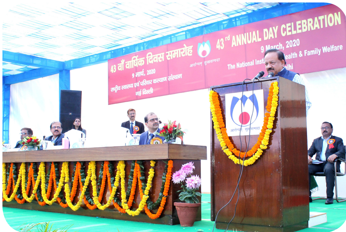
Dr. Harsh Vardhan, Union Minister for Health & Family Welfare and Chief Guest addressing the gathering on Annual Day

The Institute celebrated its 43 rd Annual Day on 9 th March 2020. Gracing the occasion as the Chief Guest, Dr. Harsh Vardhan, Union Minister for Health and Family Welfare stated that there is need to revamp the health system. The Government of India has started the Health and Wellness Centres across India. Further, he suggested the need for synergy and coordination between various institutions in the domain of public health and family welfare, and wished that the NIHFV takes the lead. Dr. Vardhan appreciated various activities undertaken by NIHFV on various fronts. He hoped that the Institute would strive to further expand the activities in the areas of training, academic research and education.