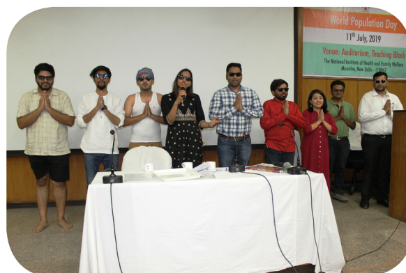
Celebration of World Population Day-2019