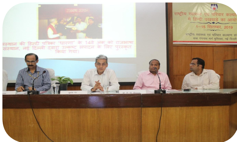
Valedictory Session of Hindi Fortnight presided by Shri Sudhansh Pant, JS, MoHFW