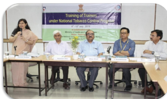
Inaugural Session of the Training of Trainers (ToT) under NTCP

Training of master trainers was conducted for capacity building of human resources for the National Tobacco Control Programme funded by the Ministry of Health and Family Welfare, GoI. A two-day consultation workshop was conducted on 22-23 April 2019 to update the prototype material and finalize the schedule of the training. A total of six trainings were conducted and 164 participants (out of 204 invited) completed the training from 37 States/ UTs.