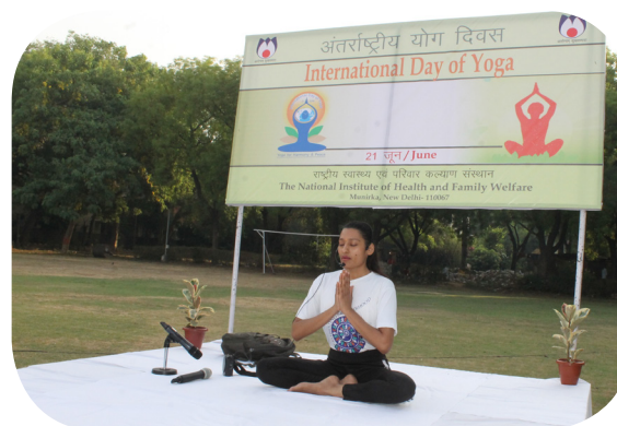
Celebration of International Yoga Day 2019