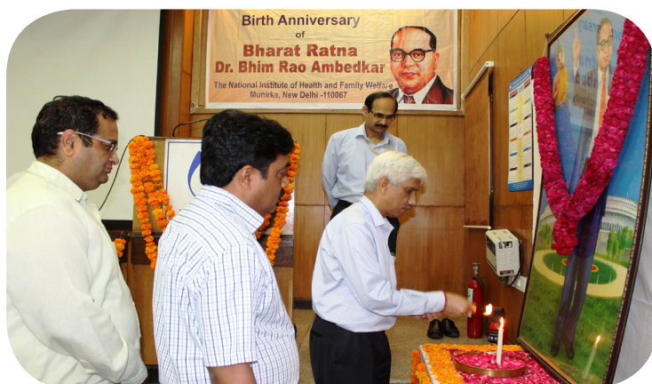
डॉ. भीमराव अंबेडकर की जयंती