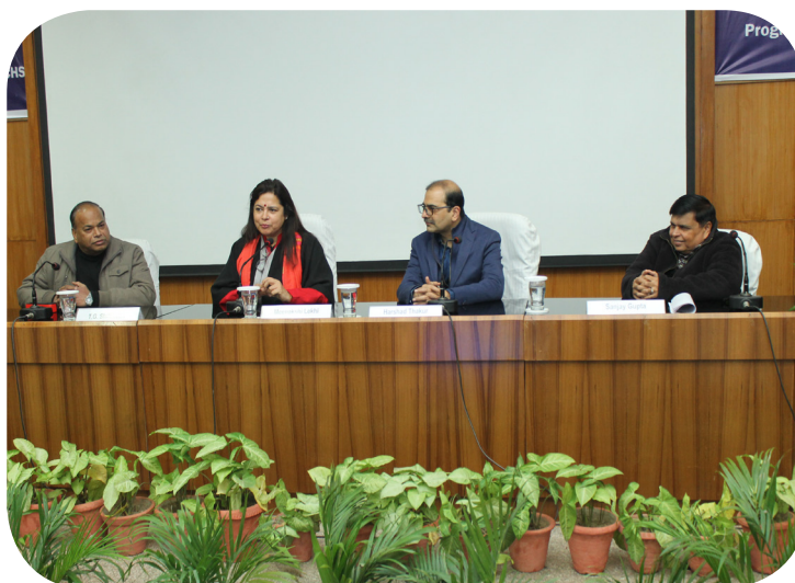
Smt Meenakshi Lekhi, Member of Parliament and Supreme Court of India Lawyer, addressing the participants of the 4th FTP GDMOs under CHS"

As a part of the training programme to enhance the competencies of GDMOs in the areas of hospital management, one-week field visits were arranged in various government and private institutes situated in the capital. Also to have holistic experience about health care delivery services of our country the entire batch was sub-divided into 14 groups, and each group visited one state for one week, during which they were taken to eminent AYUSH institutes, NGOs and the state health units like district hospitals, CHCs, PHCs and sub-centres. These visits helped the participants to realize the challenges in the health system as well as the innovative decisions taken by various states to meet these challenges. The Medical Officers also got an opportunity to visit the President's House on 23 January, 2020. In his welcome address the Honorable President deeply appreciated the role being played by the doctors and health practitioners in keeping us healthy and fit.