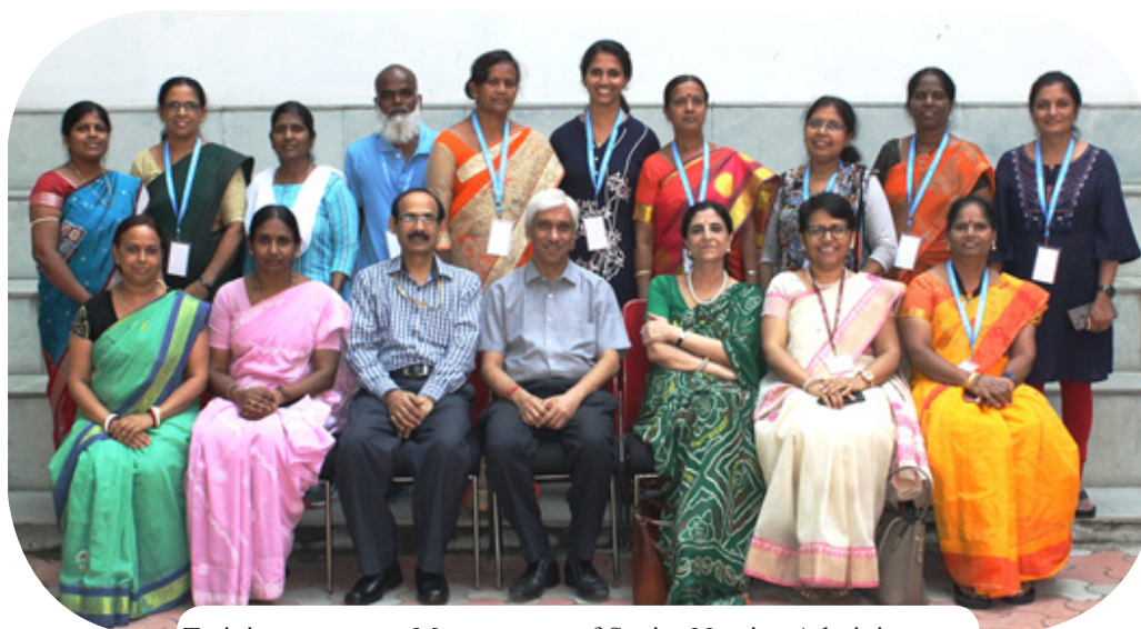
Training course on Management of Senior Nursing Administrators