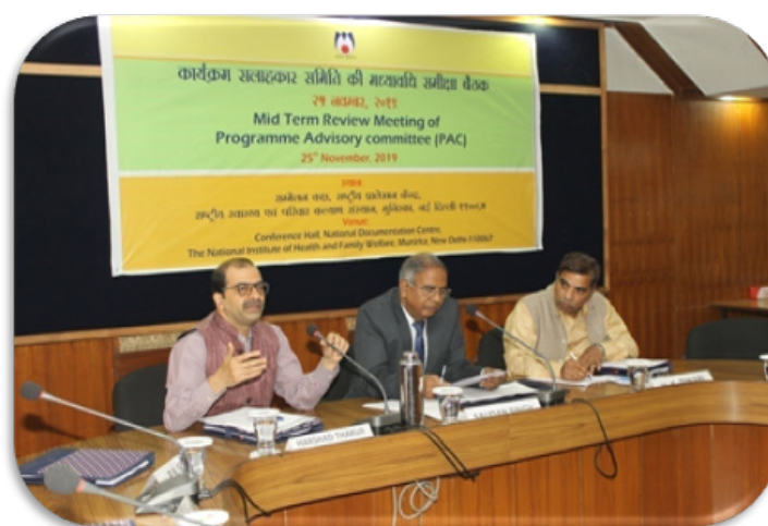
Mid-term Review Program Advisory Meeting

The Institute conducts evaluation studies of various activities and National Health Programmes initiated by the Government of India.