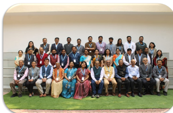
Pre Conference Brainstorming Workshop for the forthcoming Conference on Human Resources for Health: Optimizing the Health Workforce for Accelerating the Universal Health Coverage in India