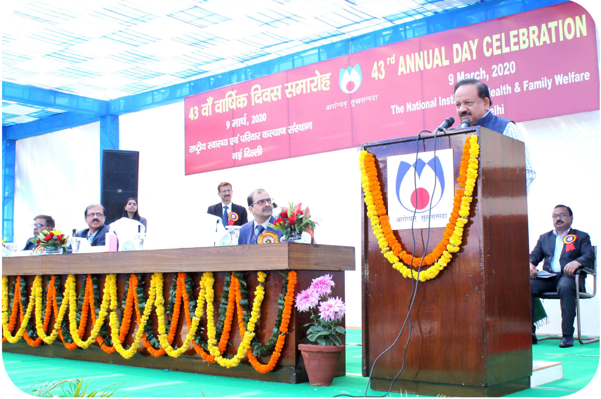
मुख्य अतिथि केंद्रीय स्वास्थ्य और परिवार कल्याण मंत्री डॉ. हर्षवर्धन वार्षिक दिवस पर सभा को संबोधित करते हुए

संस्थान ने 9 मार्च 2020 को अपना 43वाँ वार्षिक दिवस मनाया। इस अवसर पर मुख्य अतिथि के रूप में उपस्थित रहे, केंद्रीय स्वास्थ्य एवं परिवार कल्याण मंत्री डॉ. हर्षवर्धन ने कहा कि स्वास्थ्य प्रणाली में सुधार लाने की आवश्यकता है। भारत सरकार ने पूरे भारत में स्वास्थ्य एवं कल्याण केंद्र शुरू किए हैं। इसके अलावा, उन्होंने जन स्वास्थ्य एवं परिवार कल्याण के क्षेत्र में विभिन्न संस्थानों के मध्य तालमेल तथा समन्वय की आवश्यकता का सुझाव दिया, साथ ही उन्होंने कामना की कि रास्वापक. संस्थान इस कार्य में नेतृत्व करे। डॉ. हर्षवर्धन ने संस्थान द्वारा विभिन्न मोर्चों पर की गई विभिन्न गतिविधियों की सराहना की। उन्होंने आशा व्यक्त की कि संस्थान प्रशिक्षण, अकादमिक अनुसंधान तथा शिक्षा के क्षेत्र में गतिविधियों को और अधिक बढ़ाने का प्रयास करेगा।।