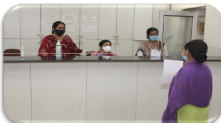
Patients Registration at Reception of NIHFW Clinic

The Institute is recognized as one of the centres of excellence in reproductive health care. The Clinical services are provided from the Clinic of RBM Department at the NIHFW. The services for management of infertility, management of reproductive endocrinological and gynaecological disorders, antenatal care, immunization of antenatal patients, infants & children and contraception are provided. In the afternoon,