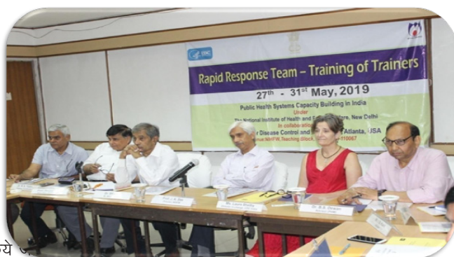
त्वरित प्रतिक्रिया टीम प्रशिक्षण

संस्थान में यूएस सेंटर फॉर डिजीज कंट्रोल एंड प्रिवेंशन के सहयोग से वर्ष 2014 में 'भारत में जन-स्वास्थ्य प्रणाली क्षमता निर्माण परियोजना' की स्थापना की गई। पीएचएससीबीआई परियोजना, वैश्विक स्वास्थ्य सुरक्षा एजेंडा के अंतर्गत कार्य करती है, जहाँ अमेरिकी सेंटर फॉर डिजीज कंट्रोल एंड प्रिवेंशन, भारत सरकार को 'भारत देश में जन-स्वास्थ्य कर्मचारियों की क्षमता निर्माण' में तकनीकी और वित्तीय सहायता प्रदान करने में सहायता करती है। पीएचएससीबीआई परियोजना के अंतर्गत निम्नलिखित तीन अलग-अलग प्रशिक्षण संचालित किये