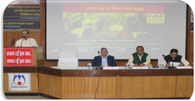
बाल दिवस के अवसर पर कार्यशाला-सह- व्याख्यान का उद्घाटन सत्र